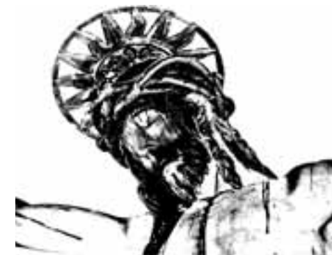
FIESTAS DEL SANTÍSIMO CRISTO MMXIII