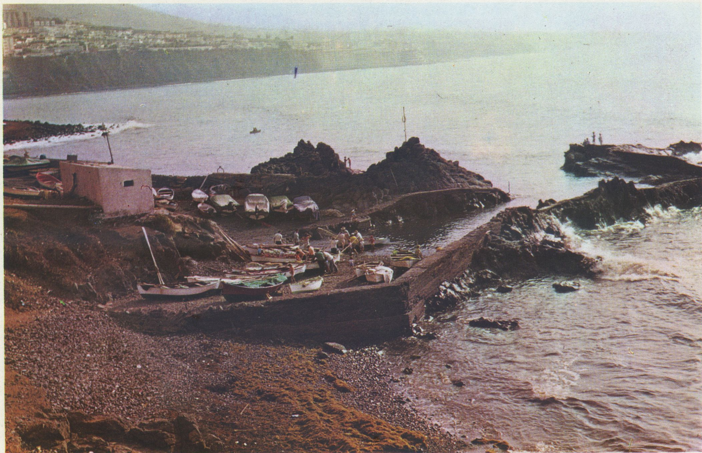
PUNTA DEL HIDALGO. La Hoya presenta un conjunto que puede denominarse bello desorden artístico; rocas bañadas por el mar color turquesa, donde varan las barcas los pescadores cuando regresan de la dura faena.