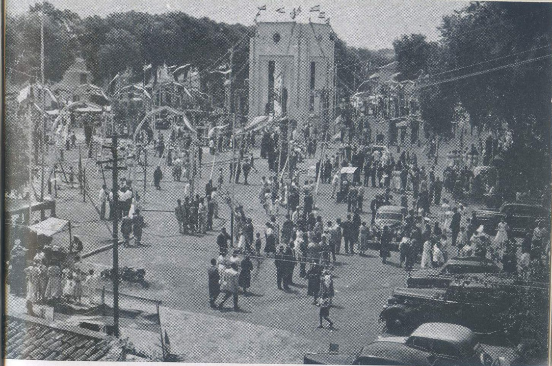
Un momento de la plaza de San Francisco. Aquel en que la muchedumbre comienza a afluir al conjuro de una fecha.

En este día se celebrarán distintos espectáculos populares que se anunciarán en programas especiales