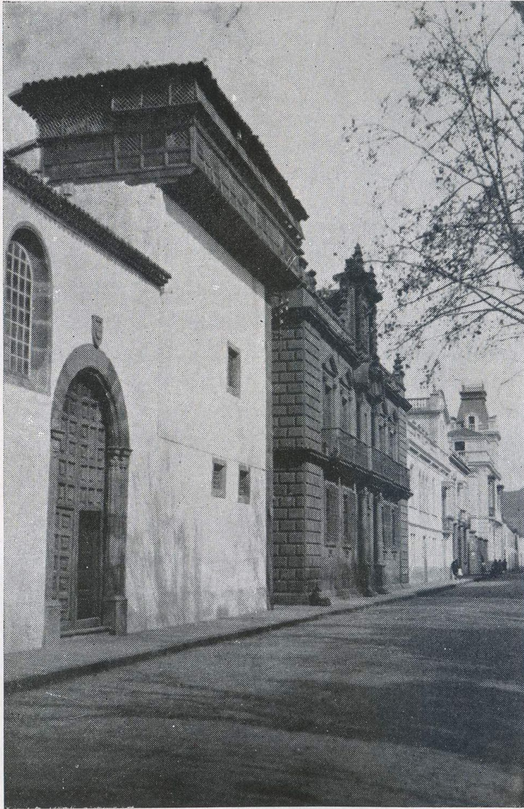
El convento de Santa Catalina de Sena, sobre el solar del palacio de D. Alonso Fernández de Lugo.