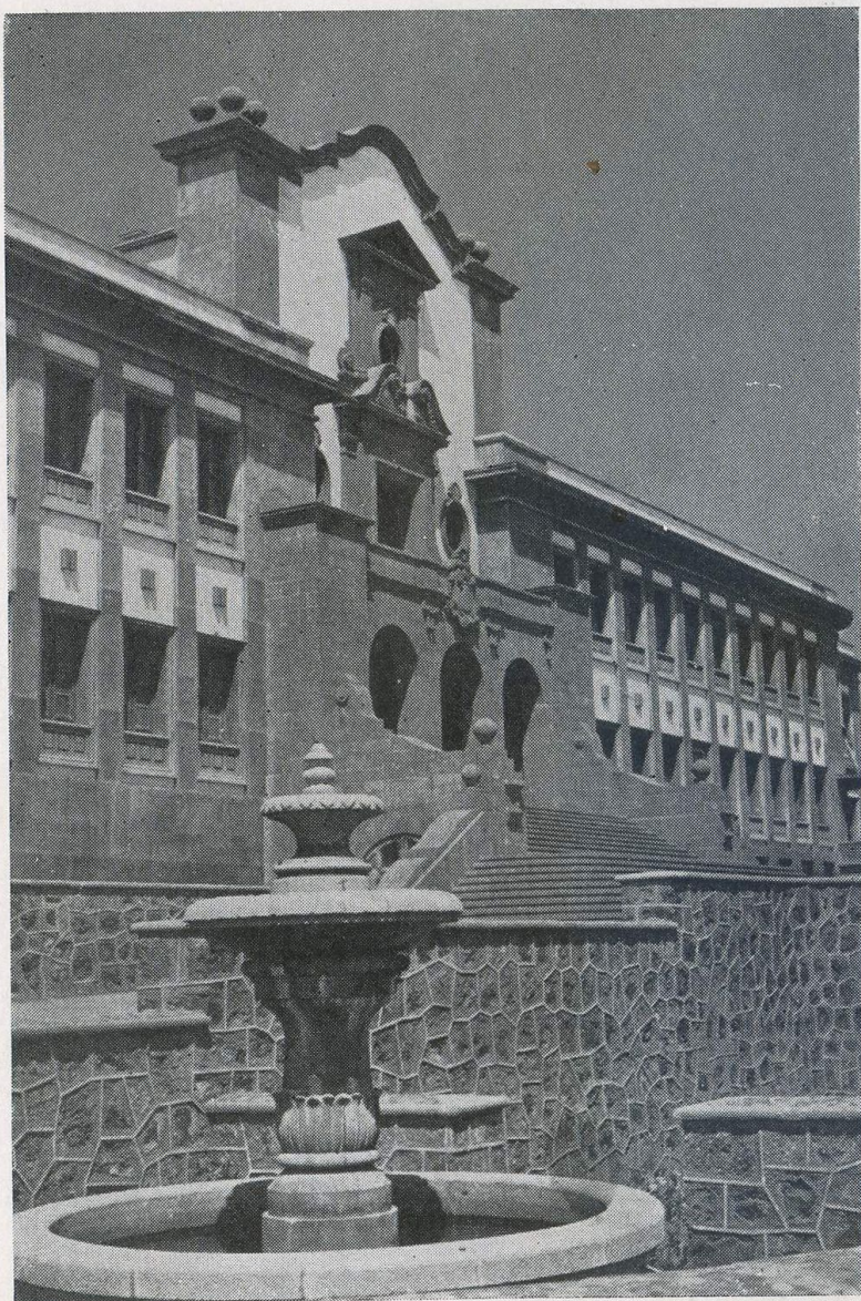
Fachada de la Universidad, alto símbolo que, con raíces en La Laguna, da nombre al Archipiélago.