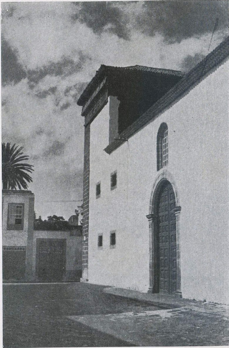
El convento de Santa Clara, sobre la calle silenciosa y plácida como un remanso.