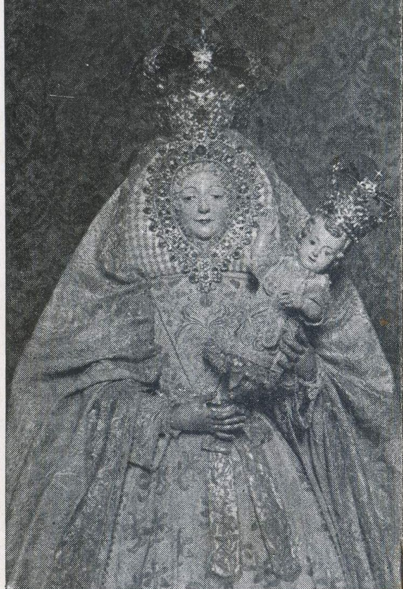
Ntra. Sra. de los Remedios que se venera en la S. I. Catedral.

que partirá de la Plaza de S. Francisco. recorrien- do las calles de N. Grimón, O. Rey Redondo, Pla- za de la Concepción, calle Adelantado, Marqués de Celada, Plaza del Dr. Olivera, calle G. Franco,