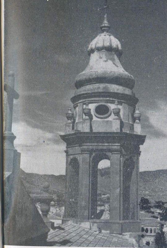
Una torre de la catedral, mojón histórico de la ciudad de las torres.