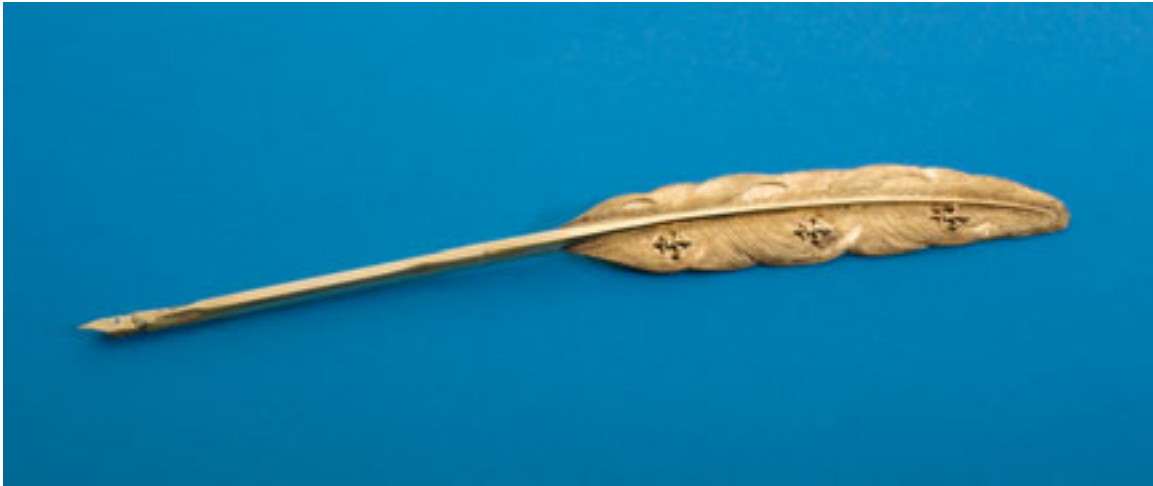
PLUMA DE ORO REALIZADA EN 1906 PARA USO DE SU MAJESTAD EL REY DON ALFONSO XIII. MUSEO DE LA PONTIFICIA, REAL Y VENERABLE ESCLAVITUD DEL SANTÍSIMO CRISTO DE LA LAGUNA