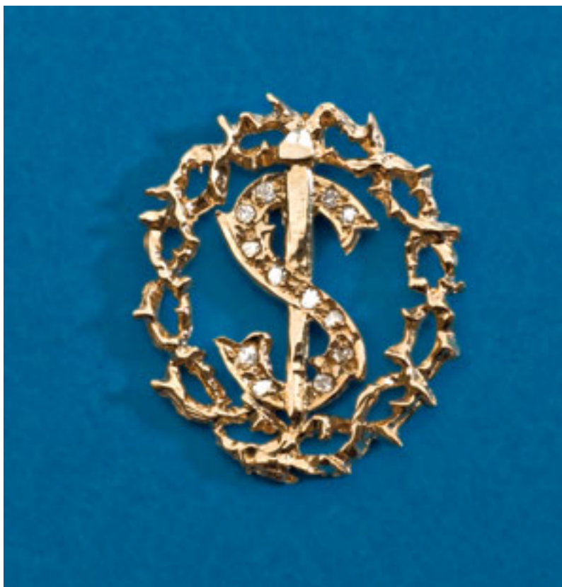
INSIGNIA DE ORO Y BRILLANTES DE LA PONTIFICIA, REAL Y VENERABLE ESCLAVITUD DEL SANTÍSIMO CRISTO DE LA LAGUNA. JOYERÍA GUZMÁN, 2006

Mientras repicaban las campanas, SS. MM. fueron despedidos en el atrio por el Sr. Obispo y por el Esclavo Mayor, a quien S. M. el Rey entregó el Bastón de plata y vara de presidencia de la Esclavitud, finalizando de este modo la Visita regia tanto tiempo esperada y de la que la Venerable Esclavitud se siente tan honrada y agradecida.