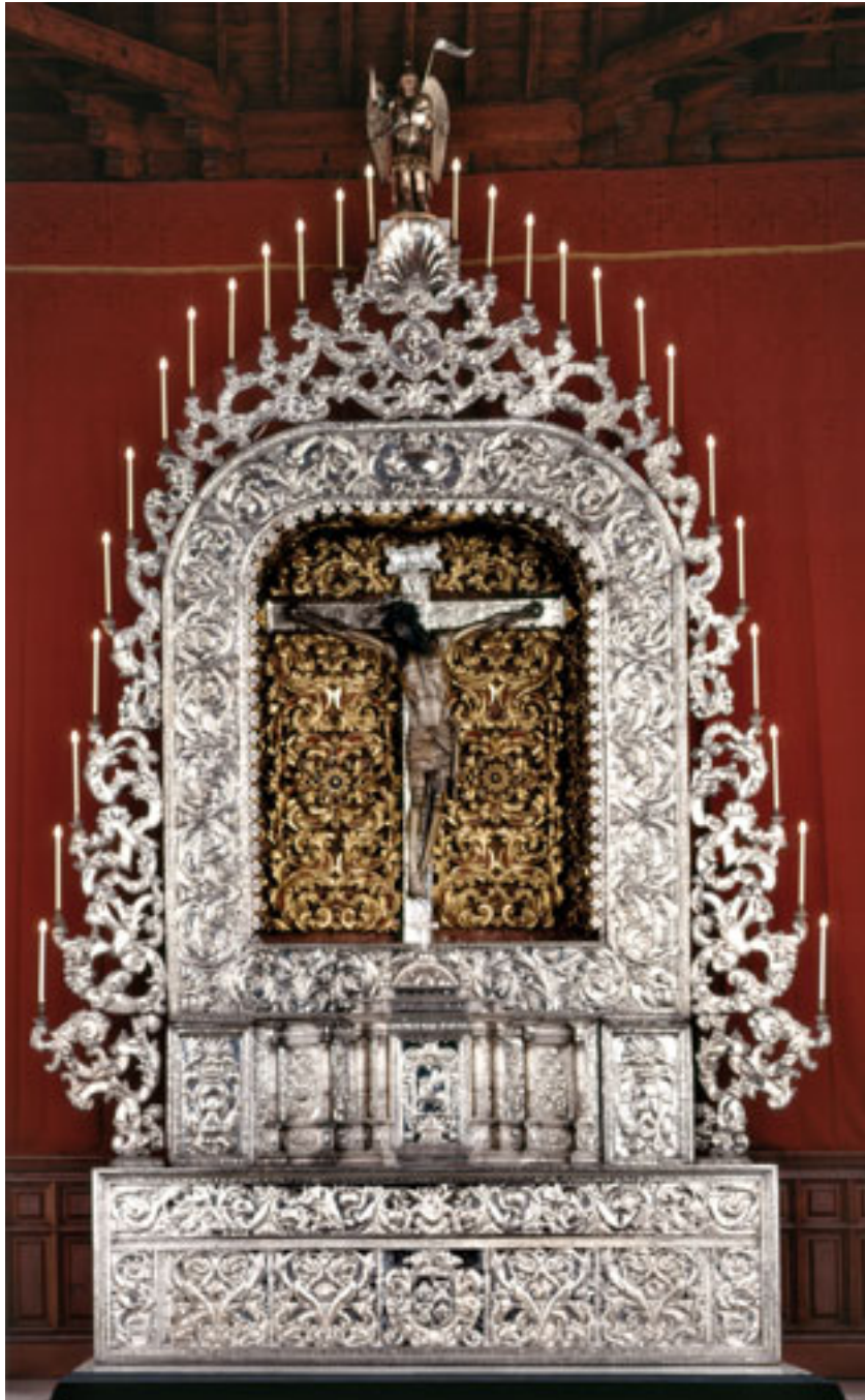
EL SANTÍSIMO CRISTO DE LA LAGUNA EN SU RETABLO