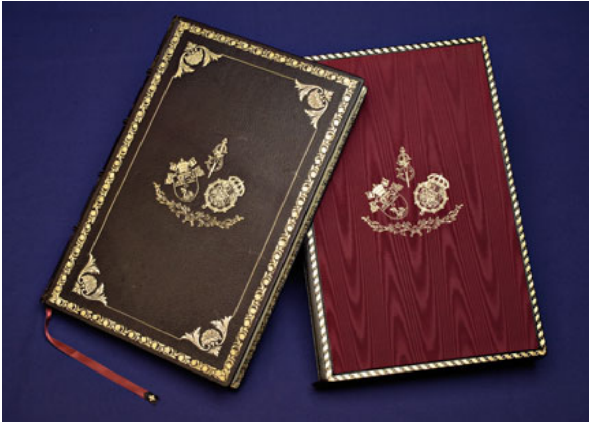
LIBRO DE FIRMAS DE LA PONTIFICIA, REAL Y VENERABLE ESCLAVITUD DEL SANTÍSIMO CRISTO DE LA LAGUNA. JESÚS CORTÉS GÁLVEZ. MADRID, 2006

Tras la firma, el Esclavo Mayor solicitó a S. M. el Rey que aceptara la insignia de oro y brillantes de la Esclavitud, que había sido confeccionada hacía más de diez años en espera de ocasión como la presente para su entrega. Su Majestad aceptó dicha insignia y, de forma espontánea, pidió al Esclavo Mayor que se la impusiera, a lo que este accedió, considerándolo un alto honor. Luego, el Esclavo Mayor presentó al Sr. Obispo, a fin de que se la entregara a SS. MM., siete medallas de oro con sus respectivas cadenas, con las imágenes grabadas del Santísimo Cristo de La Laguna y de la Virgen de Candelaria, dirigidas a los siete nietos de SS. MM., como obsequio de la Esclavitud.